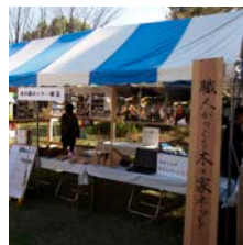
各地を巡回します