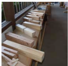
継手仕口や模型展示