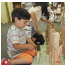
積み木で遊べます